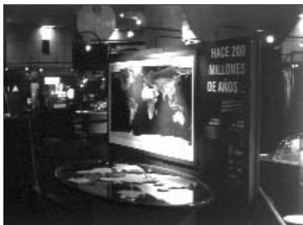
Museo de la Ciencia y el Cosmos a La Laguna di Tenerife.