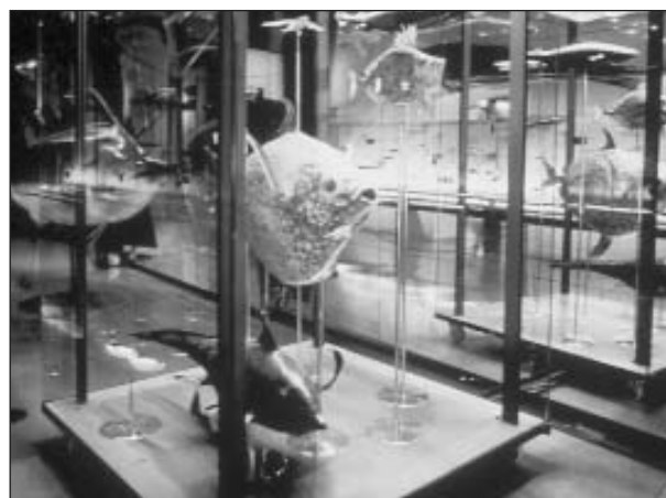
Uno scorcio dell'esposizione ittologica al Museo de la Naturaleza y el Hombre.

Questi musei sono gestiti con denaro pubblico attraverso un organismo autonomo a ciò preposto (l'OAMC: Organismo Autónomo de Museos y Centros, creato nel 1990) e, più recentemente, grazie a finanziamenti esterni provenienti soprattutto dell'impresa privata, attraverso un Dipartimento di Marketing creato nel 1995. La dinamica e la struttura stessa dell'OAMC sono diventate un importante punto di riferimento per la maggior parte dei musei di Tenerife.