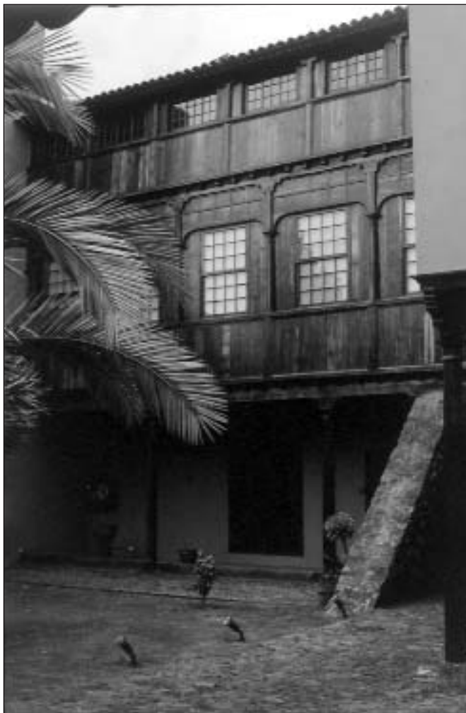
La corte del Museo de la Historia de Tenerife.