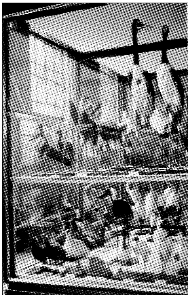
La Grande Catena dell'Essere nel primo allestimento del dopoguerra delle sale di ornitologia del Museo di Storia Naturale di Milano.

le esposizioni e il carattere degli oggetti conservati andarono incontro a un cambiamento paradigmatico. La procedura dominante che caratterizza il museo tradizionale è un atto di pietrificazione, di tassidermia, o di congelamento, che rende possibile la conservazione dell'aspetto esterno delle cose come esse si presentavano nel passato, o almeno l'illusione di questo aspetto. Il valore di "autenticità" è una conse-