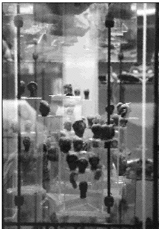
Accumulazione non articolata degli oggetti. Museo Etnusco di Villa Giulia, Roma.

Enric Franch è autore di numerosi progetti e allestimenti museali, tra cui quello per il Museo Nacional de la Ciencia i de la Técnica della Catalogna. Vive a Barcellona.